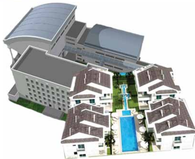
Детские сады, школы и поликлинику будут возводить одновременно с жилыми массивами.