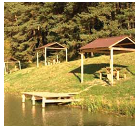
Аквапарк, лодочная станция и отдых на воде порадуют детей и взрослых и позволят провести время всей семьей.