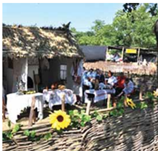
Этнографический центр с клубом для верховой езды и зоосадам украсят «Олимпийский».