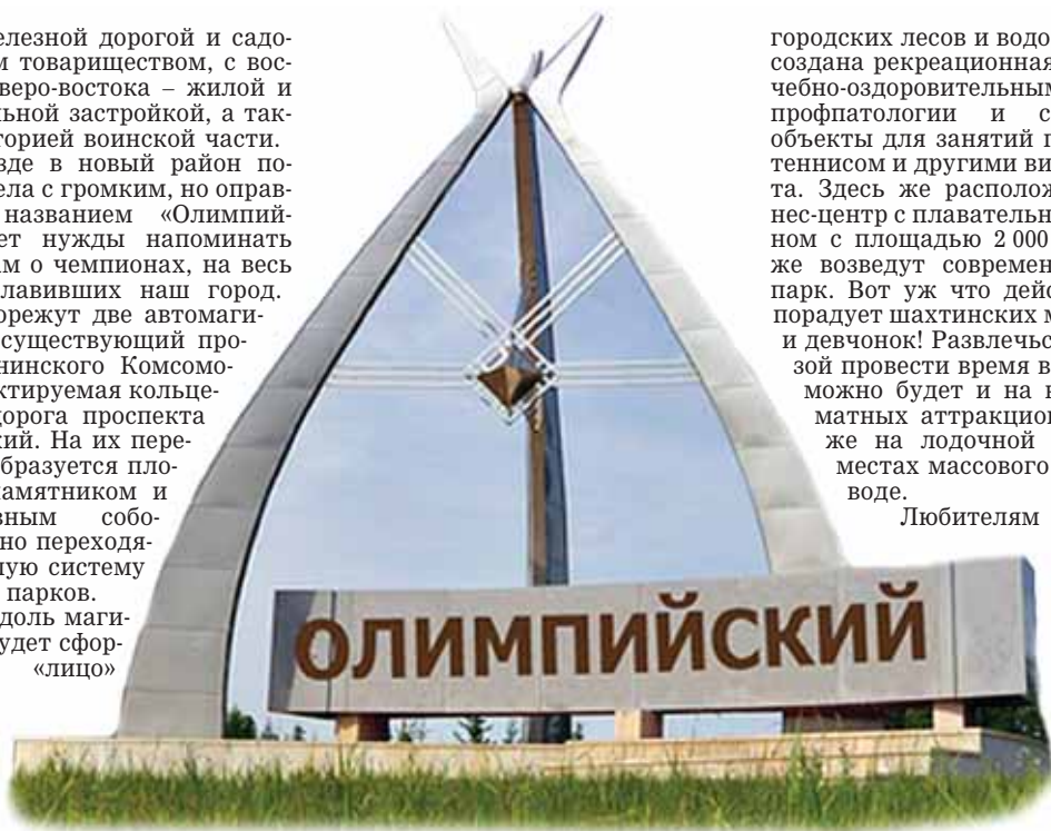
В будущее - с новым районом.

Далее вдоль магистралей будет сформировано «лицо»