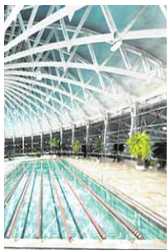
Спортивно-развлекательные комплексы с плавательными бассейнами позволят шахтинцам заниматься профессиональными видами спорта, а также посещать различные секции.